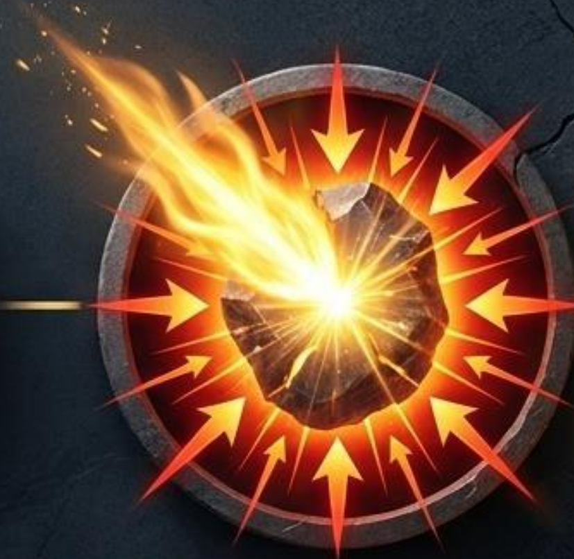
El Conocimiento de Dios