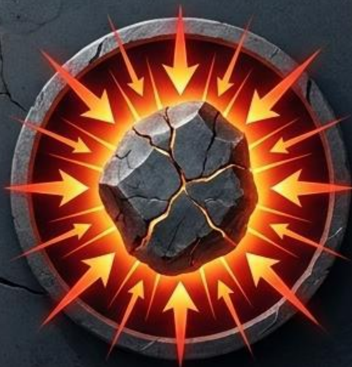
Presión y Persecución (Pruebas)