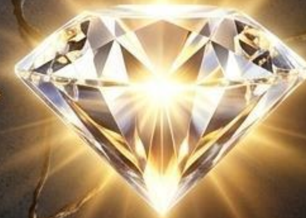
Carácter Formado y Establecido

1 Pedro 5:10 - Después de que hayáis padecido un poco de tiempo, Él mismo os perfeccionará, afirmará, fortalecerá y establecerá.